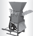
Trituradores para milho úmido