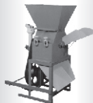
Trituradores para milho úmido