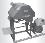
Moendas de Cana