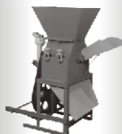
Trituradores para milho úmido