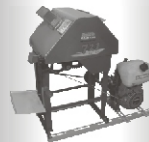
Moendas de Cana